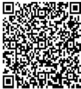
财政学与公共管理 决策实验操作视频